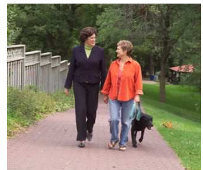
Karen Farbridge, maire de Guelph, en promenade