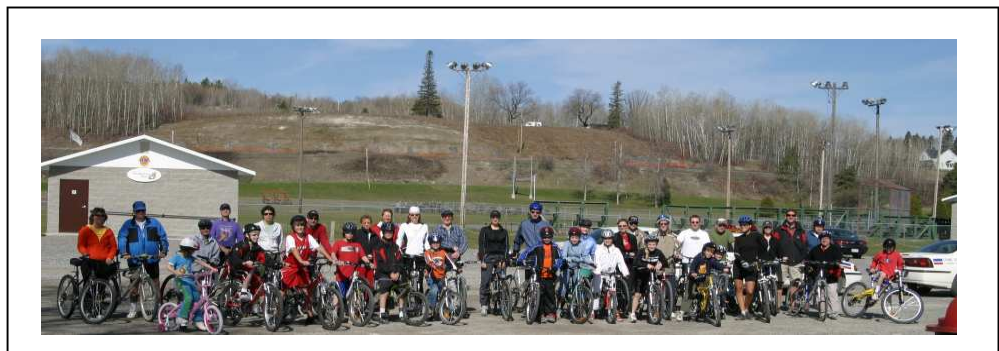
Grâce à STATO, le transport actif est en plein essor à South Temiskaming

50 podomètres de la firme StepsCount en tant que ‘prix aux inscrits hâtifs’... Et nous en sommes très reconnaissants car nous espérons utiliser nos podomètres lors de nos levées de fonds et nos activités de marche. Nous attendons avec impatience le moment de planifier et d’animer un événement MRM dans notre collectivité, de faire partie de la ‘Marcholution’... et de contribuer à établir un nouveau RECORD MONDIAL ! »